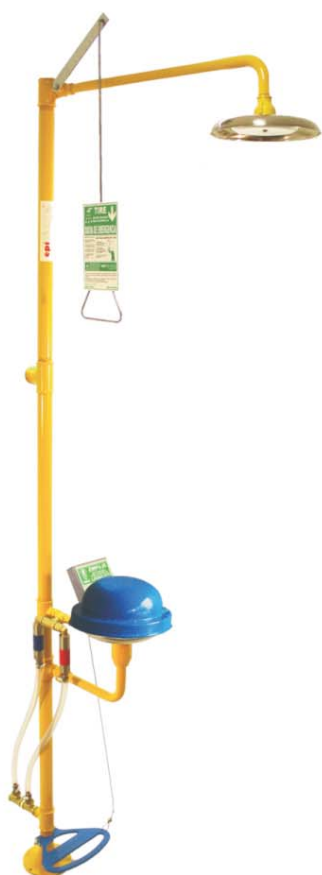
Douche et Lave-yeux Anti-Congelation Anti-Brûlure Article 6011ACE

De plus, nous avons un système automatique qui évite la surchauffe de l'eau des canalisations à cause du soleil, empêchant que sorte de l'eau chaude quand on actionne la Douche et le lave yeux.