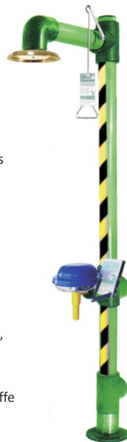
Douche et Lave-yeux Anti-Congelation avec HEAT TRACING Article 6011FPHT