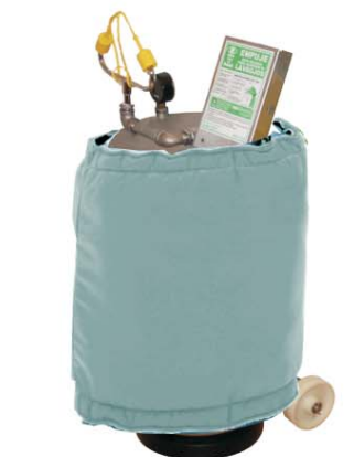
Lave-yeux Portable avec Couverture Thermique Article 6051R2D2AC

Les lave yeux anti-congélation d'Epitecnica éliminent automatiquement toute l'eau résiduelle du lave yeux, évitant qu'il se congèle et que la valve et le lave yeux se cassent .