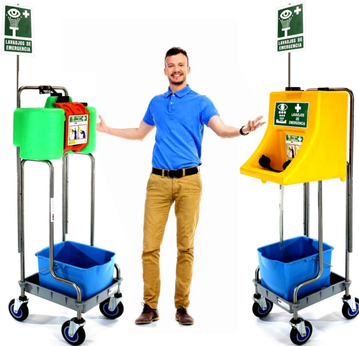
LE CHARIOT 6684 N'INCLUT PAS LES LAVE-YEUX

Le chariot avec bac de récupération d'eau transforme le lave-yeux mural en élément transportable, ce qui permet d'avoir facilement le lave-yeux sur les lieux à risque.